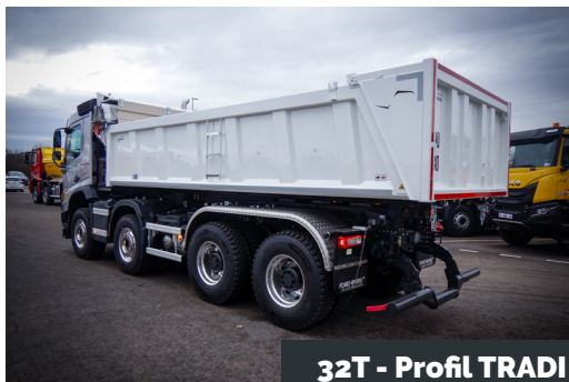
32T - Profil TRADI