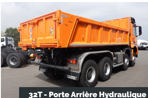
32T - Porte Arrière Hydraulique