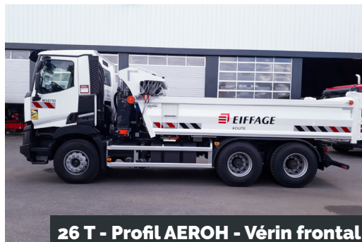
26 T - Profil AEROH - Vérin frontal