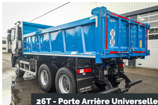
26T - Porte Arrière Universelle